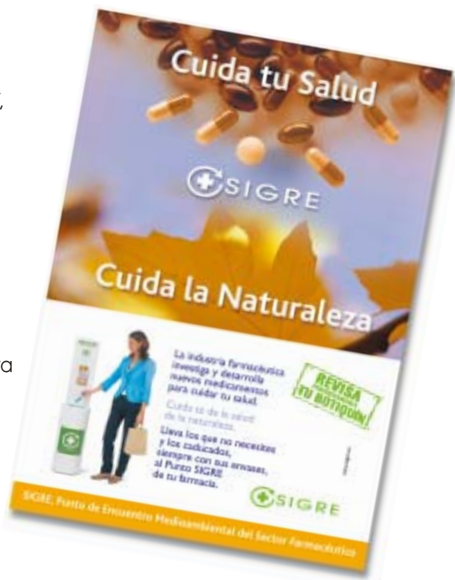
CARTEL DE LA CAMPAÑA

También se editarán carteles para su distribución en Establecimientos Sanitarios, Centros de la Tercera Edad, Ayuntamientos, etc.