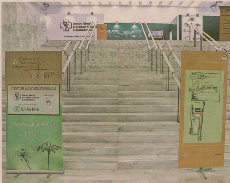
Sede del XVI Congreso Nacional Farmacéutico organizado en Badajoz del 22 al 24 de octubre de 2008.

La Fundación Centro de Recursos Ambientales de Navarra ha preparado una guía con criterios que convierten un evento en respetuoso con el entorno. Entre sus iniciativas propone favorecer el consumo responsable durante el acto, por ejemplo habilitando depósitos para los materiales que los congresistas desechen. La organización puede, además, instalar surtidores de agua en los lugares de encuentro para minimizar los envases, reducir el consumo de papel y utilizar soportes virtuales, ofrecer alimentos ecológicos y planificar la necesidad de comida para reducir la producción de residuos innecesarios. La guía destaca además la importancia de informar a los asistentes de la política medioambiental del evento y cómo deben usar las instalaciones para garantizar su sostenibilidad.